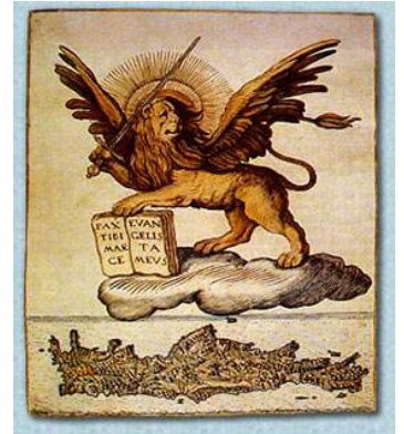
Ο φτερωτός λέων της Βενετίας πάνω από την Κρήτη.