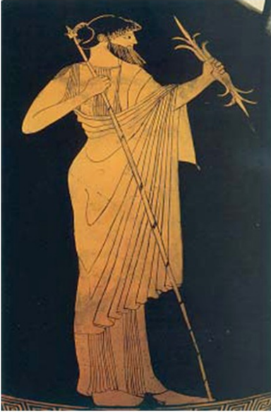
4. Ο Δίας κρατώντας το σκήπτρο και τον κεραυνό. Από αρχαίο ελληνικό αγγείο.