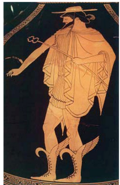
5. Ο Ερμής κρατώντας το κηρύκειο. Από αρχαίο ελληνικό αγγείο.